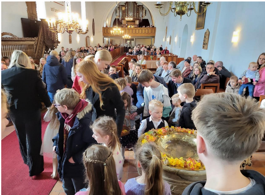
Mit Feuereifer dabei: Kinder im Taufgottesdienst

Meldet Euer Kind gerne rechtzeitig an! Wir freuen uns auf Euch